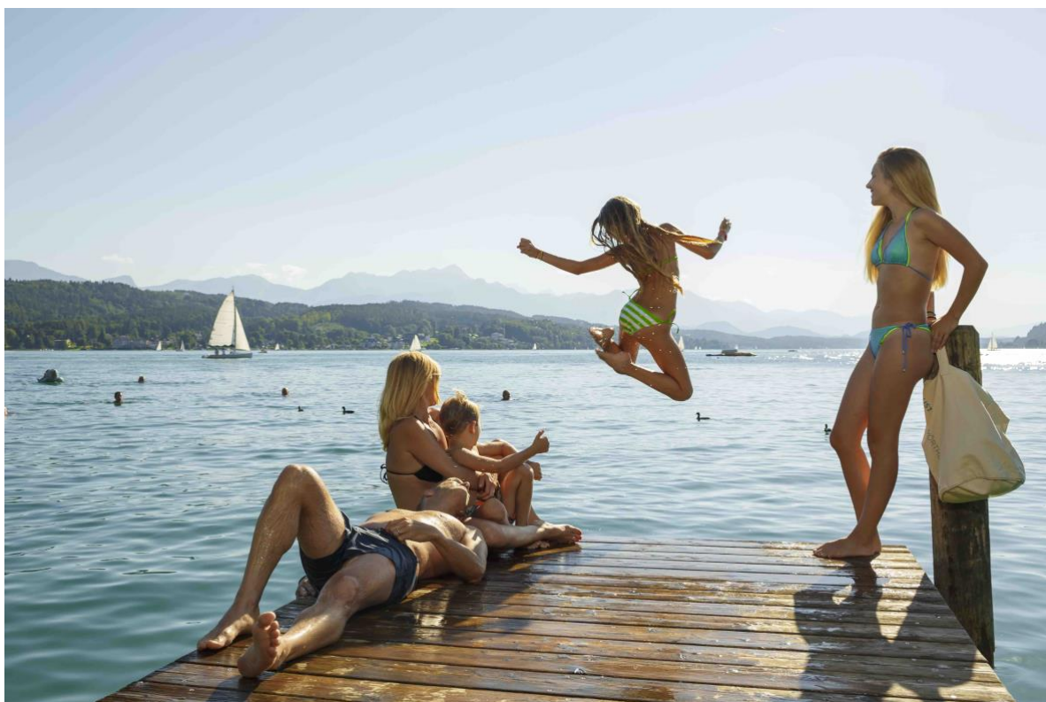
estate al lago Wörthersee

Per chi cerca il benessere, una visita alla casa balneare Werzer's Badehaus aiuta a liberare lo spirito. Costruito nel 1895, l'edificio è stato restaurato e dal 2013 offre al pubblico tutti i vantaggi di una moderna spa: saune sul lago, una piscina riscaldata aperta tutto l'anno, suggestive oasi relax e un ristorante per buongustai che soddisfa ogni desiderio.