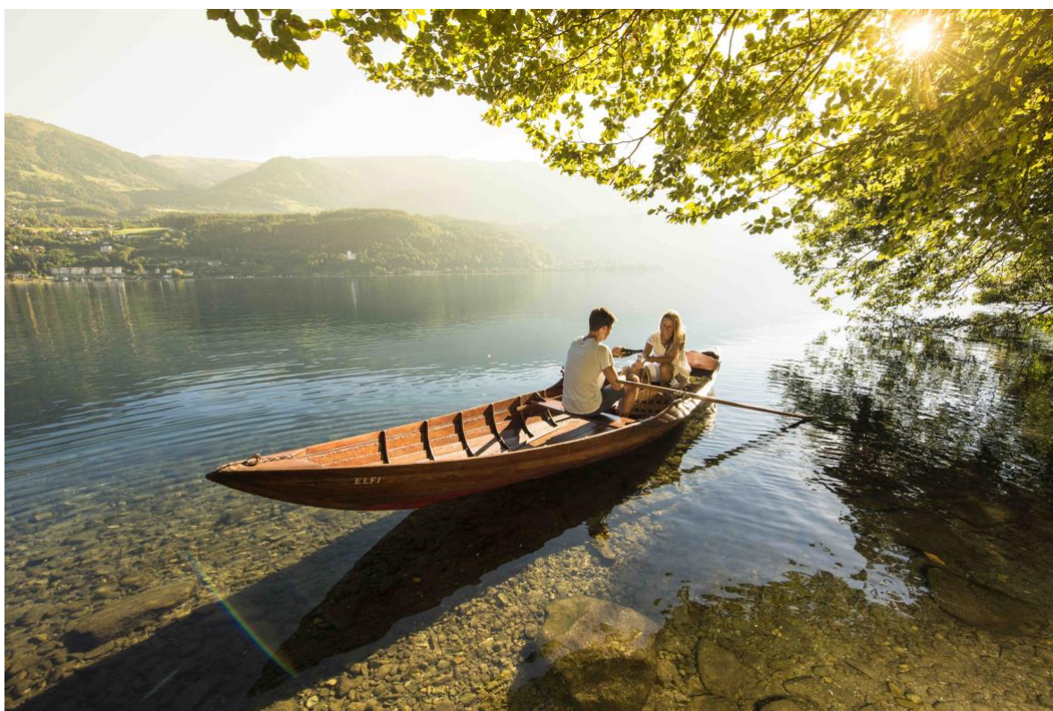
gita romantica in barca a remi sul lago Millstätter See

Un'altra esperienza romantica da fare sul lago Millstätter See è una cena per due su una zattera ancorata al centro del lago. Al tramonto, dopo un aperitivo sulla spiaggia, un motoscafo trasporta la coppia sulla zattera, dove un solo tavolo imbandito li attende a lume di candela. Un gastronomo di alto livello prepara una cena di 7 portate, con piatti prelibati carinziani, in esclusiva per la coppia. La cena per due sul lago Millstätter See è organizzata dal KOLLERS Hotel****Superior di Seeboden.